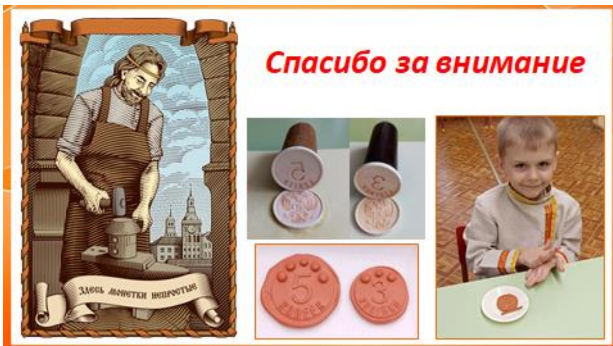
23. Спасибо за внимание!