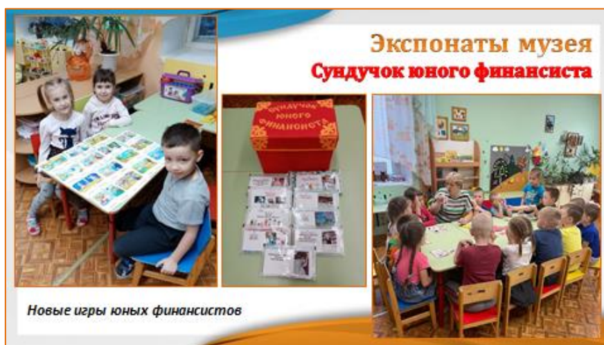
Новые игры юных финансистов

41. Разрезные картинки помогают не только пополнить знания, но и развивают логическое мышление.